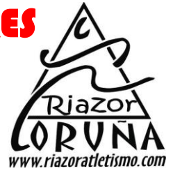
Sub 10 Benxamín