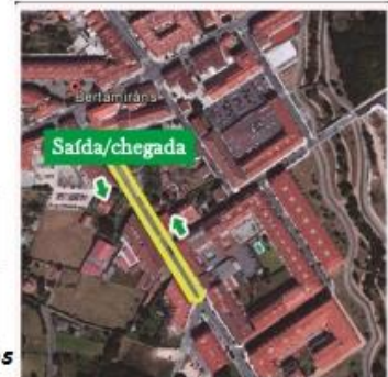
* Percorrido de 350 metros