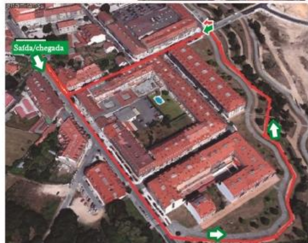
* Percorrido de 1000 metros